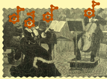
Gravure de Frederick Wentworth, 1872, photographie © Wolfgang Moroder.