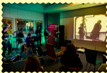
Festival Synchro 2023 © Franck Alix.

Entrée gratuite dans la limite des places disponibles Plateau-média, isdaT, 5 quai de la Daurade, Toulouse Également disponible en live et replay sur la chaîne YouTube de l'isdaT