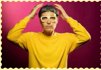
Portrait de matali crasset © Joël Saget, AFP.