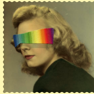
Visuel ©Julie Cockburn, photographie trouvée brodée, « The Meteorologist », 2014.

Entrée gratuite sur réservation Auditorium Saint-Pierre des Cuisines, 12 place Saint Pierre, Toulouse