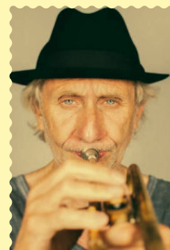
Portrait d'Erik Truffaz

Entrée gratuite dans la limite des places disponibles Librairie Ombres blanches, 50 rue Léon Gambetta, Toulouse