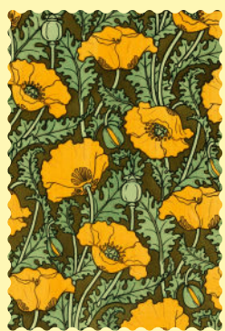
Eugène Grasset, La Plante et ses applications ornementales, 1896.