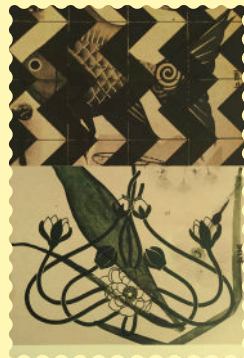
Macule d'imprimerie, livre <i>Formes et couleurs</i>, Valérie du Chéné, isdaT éd. 2022.

Exposition Couloir n°9, publication Formes et couleurs