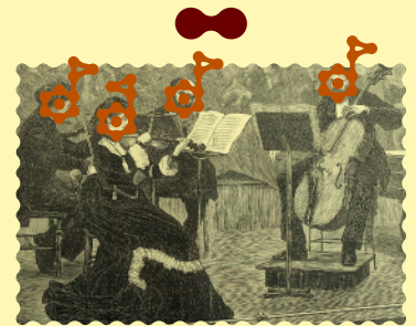
Gravure de Frederick Wentworth, 1872, photographie © Wolfgang Moroder.

Entrée gratuite dans la limite des places disponibles Plateau-média, isdaT, 5 quai de la Daurade, Toulouse Conférence également disponible en live et replay sur la chaîne YouTube de l'isdaT