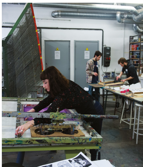
Journées Portes Ouvertes de l'isdat © Franck Alix, mars 2018.