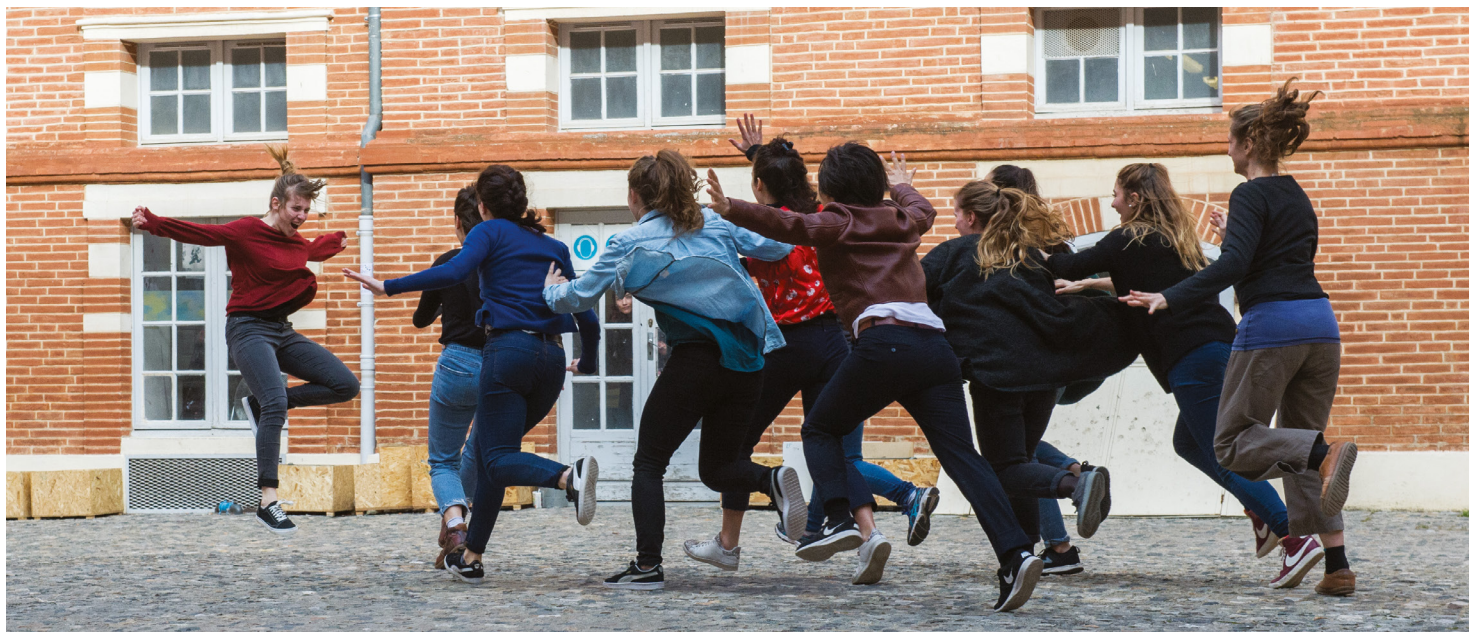
Soulèvement, création chorégraphique de Pierre Rigal. Journées Portes Ouvertes de l'isdat © Franck Alix, mars 2018.