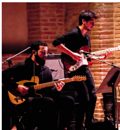
Moondog — Regards croisés par les étudiants musiciens et danseurs © Franck Alix, décembre 2018.