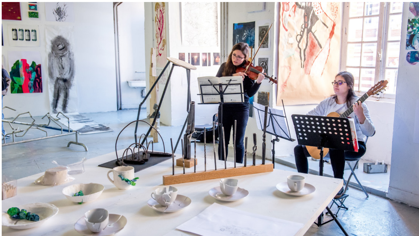
Journées Portes Ouvertes de l'isdaT © Franck Alix, février 2019.

L'isdaT s'inscrit dans un vaste réseau local, national et international qui lui donne une grande capacité de partenariats, et offre ainsi aux étudiant·es un ancrage et une mobilité de première importance. Avec les cours extérieurs, l'isdaT permet à toutes les personnes de tous les âges de pratiquer et de se perfectionner dans le champ des arts plastiques. Par ailleurs, l'isdaT propose de la formation continue principalement dans les domaines de la musique et de la danse, et projette de développer de nouvelles offres dans les autres domaines. En évoluant, l'isdaT prépare ses étudiant·es aux métiers et aux enjeux de demain, tout en étant fortement ancré dans sa riche histoire.