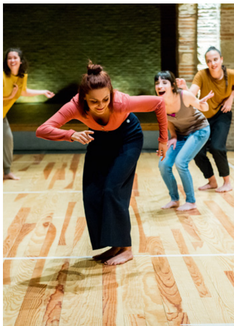
Spectacle Ou bien, dansons maintenant ! © Franck Alix, mai 2019.