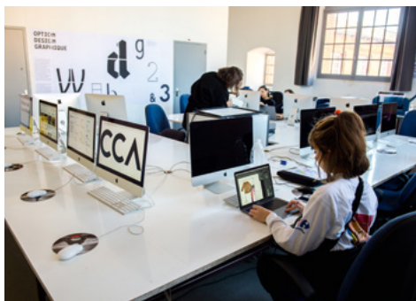
Journées Portes Ouvertes de l'isdaT © Franck Alix, février 2019.