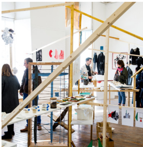
Journées Portes Ouvertes de l'isdaT février 2019.