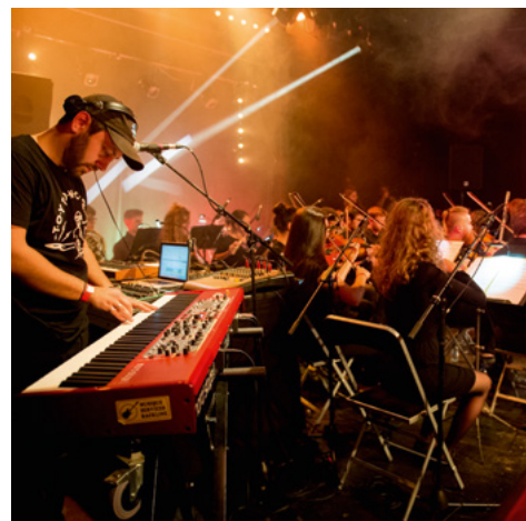
Concert L'isdaT invite Mangabey © Franck Alix, novembre 2019.