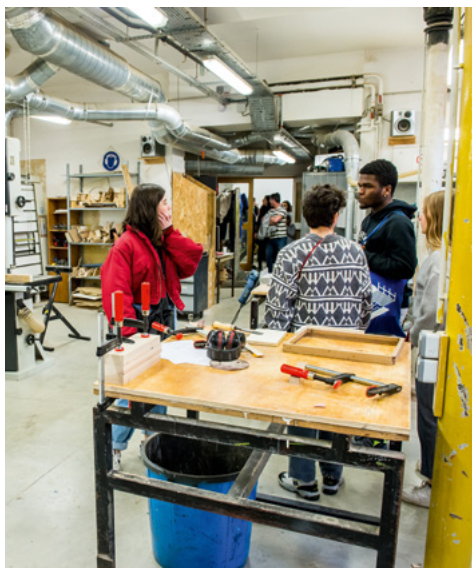
Journées Portes Ouvertes de l'isdaT © Franck Alix, février 2019.