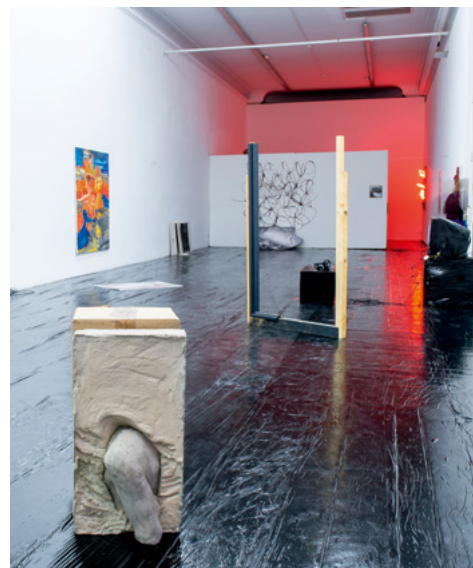
fjdeulfihxzukftikgrrehmd , exposition des diplômé-es DNSEP 2019 de l'isdaT © Franck Alix, septembre 2019.