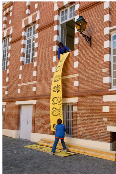
L'Usine à dessins , performance des cours adultes, Journées Portes Ouvertes de l'isdaT © Franck Alix, février 2019.

L'isdaT — institut supérieur des arts de Toulouse est un établissement public d'enseignement supérieur dédié aux arts plastiques, au design, au design graphique, à la musique et à la danse.