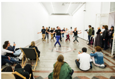
Journées Portes Ouvertes de l'isdaT © Franck Alix, février 2019.