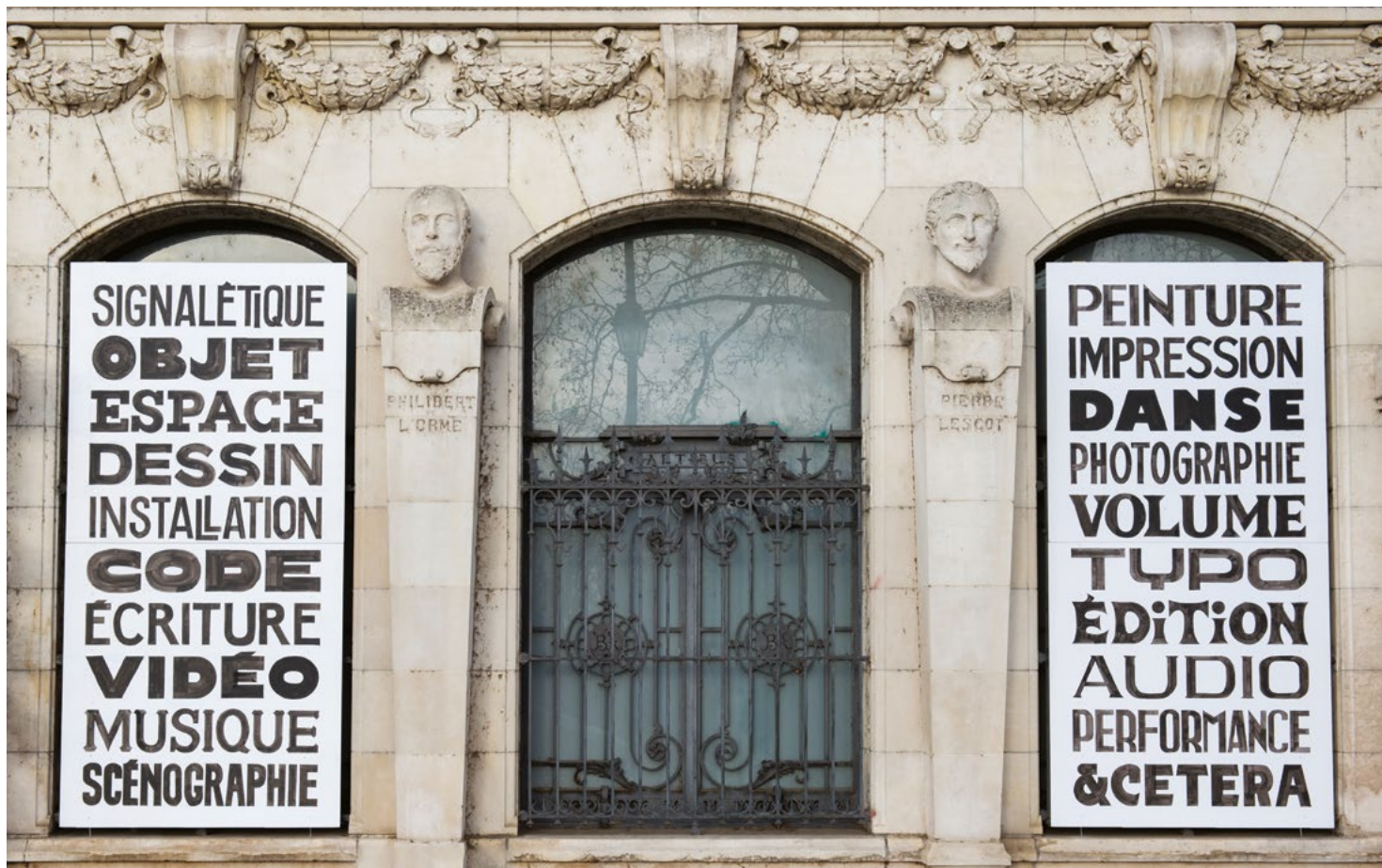
Workshop avec Alaric Garnier, installation lors des Journées Portes Ouvertes de l'isdat, mars 2017 © Franck Alix.