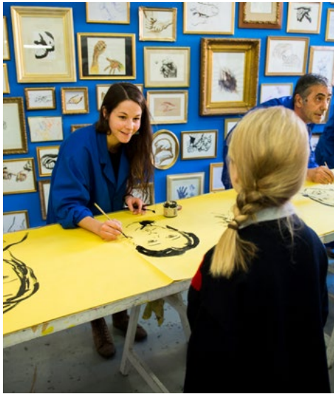
L'Usine à dessins, cours adultes, JPO février 2019 © Franck Alix.