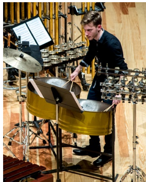
La Percu'Ose, concert à l'auditorium Saint-Pierre des Cuisines, février 2019 © Franck Alix.

Véritable laboratoire de talents au cœur de Toulouse, l'institut supérieur des arts de Toulouse forme des artistes, créatrices et créateurs dans plusieurs domaines, faisant de cet établissement d'enseignement supérieur public un lieu unique en France de dialogue artistique et pédagogique.