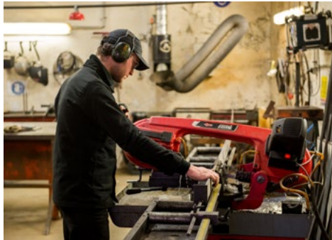
Journées Portes Ouvertes de l'isdaT, février 2019 © Franck Alix.