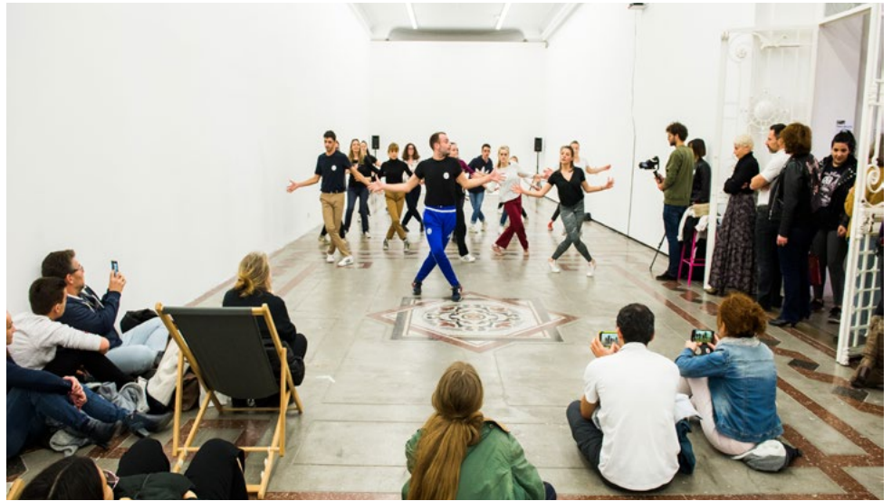
Atelier de danse jazz, JPO février 2019 © Franck Alix.