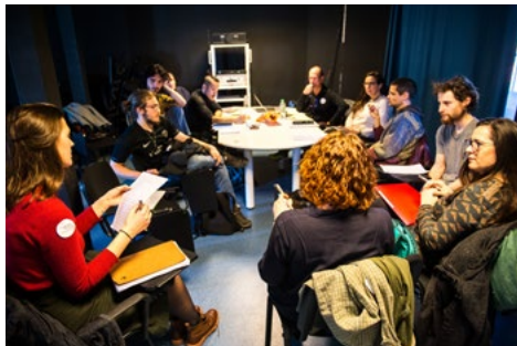
Journées Portes Ouvertes de l'isdaT, février 2019 © Franck Alix.