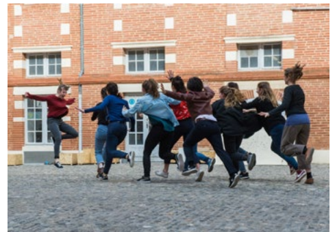
Soulèvement, chorégraphie de Pierre Rigal, JPO mars 2018 © Franck Alix.