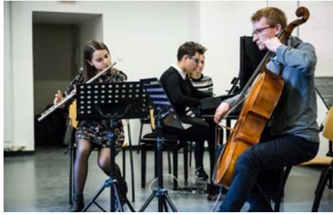
Journées Portes Ouvertes de l'isdaT, février 2019 © Franck Alix.