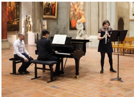
Nuit des étudiants, musée des Augustins, avril 2018 © isdaT.