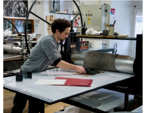
Journées Portes Ouvertes de l'isdaT, mars 2016