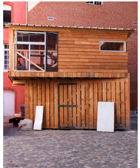
La Dent Creuse, récupérathèque de l'isdaT.