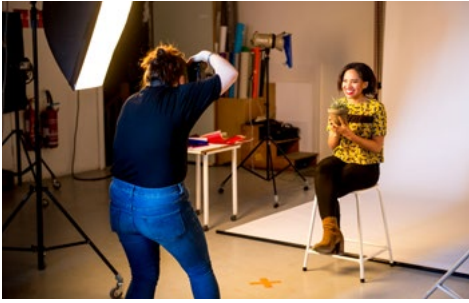
Journées Portes Ouvertes de l'isdaT, février 2019 © Franck Alix.