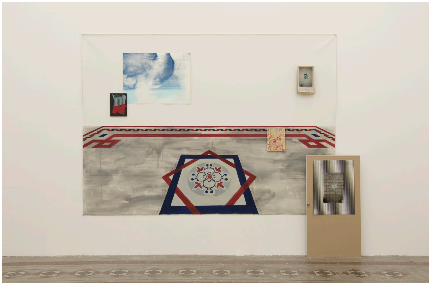
Visuel : Les bords perdus (version 1, juillet 2015) , Emmanuel Simon, 2015