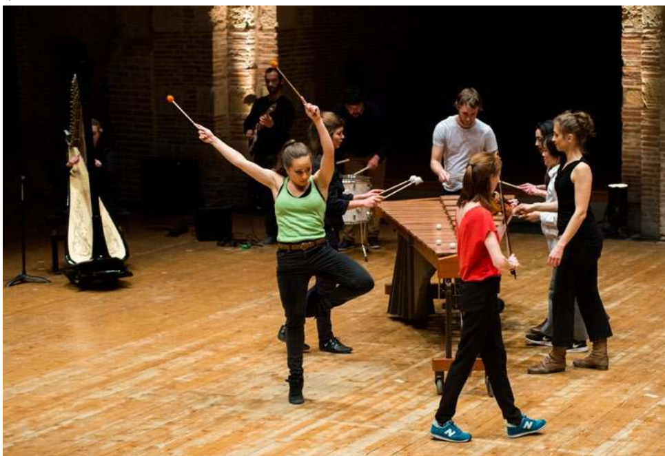
Spectacles d'ouverture des Journées Portes Ouvertes © Franck Alix, mars 2017.