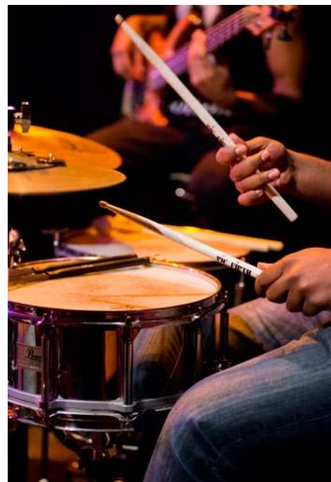
Concert à la Cave Poésie © Franck Alix, février 2016.