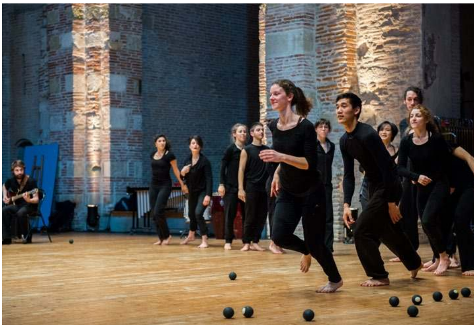
Répétitions des spectacles d'ouverture des Journées Portes Ouvertes © Franck Alix, mars 2017.

Le département spectacle vivant de l'isdaT est l'unique pôle supérieur au plan national à offrir les trois options jazz, classique et contemporain du Diplôme d'État Danse, ainsi que tous les instruments et options pour ses diplômés musicaux – Diplôme d'État Musique et Diplôme National Supérieur Professionnel de Musicien – en formation initiale et continue.