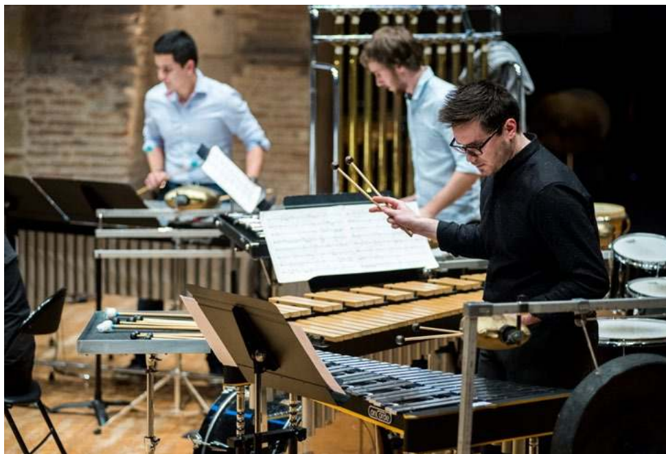
Spectacles d'ouverture des Journées Portes Ouvertes © Franck Alix, mars 2017.