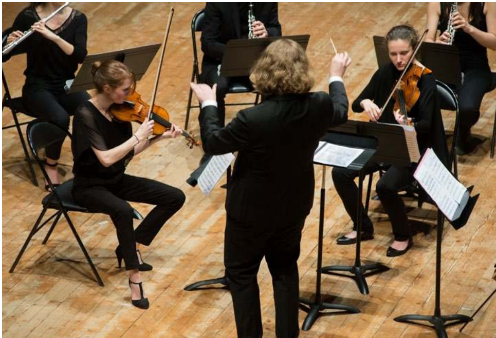
Spectacles de clôture des Journées Portes Ouvertes © Franck Alix, mars 2018.