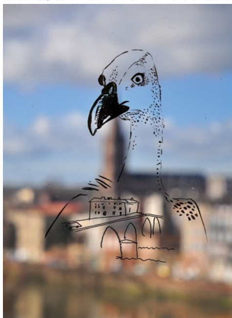
Cours adultes, exposition au Muséum de Montauban. Photographie © Olivier Duchein.