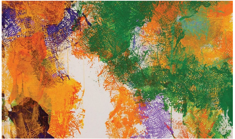
Cours adultes de Martine Gélis.