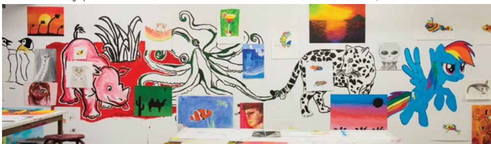
Cours enfants et adolescents, Journées Portes Ouvertes de l'isdaT, mars 2016.