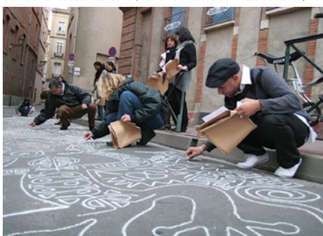
Cours adultes.