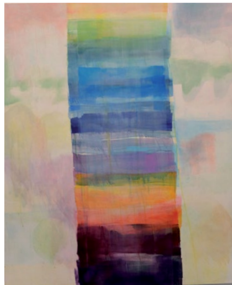
Cours adultes de Martine Gélis.