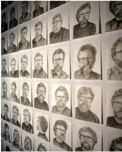
Exposition cours adultes.