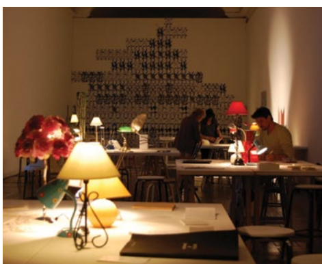
Cours adultes.