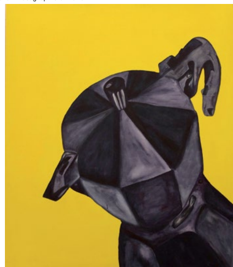
Cours adultes de Martine Gélis.