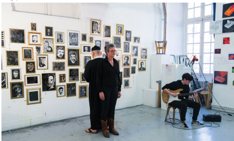
Cours adultes, Journées Portes Ouvertes de l'isdaT, mars 2018.