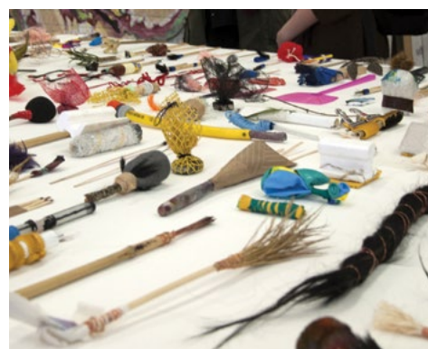
Journées Portes Ouvertes de l'isdaT, mars 2015 © Jules Severac.