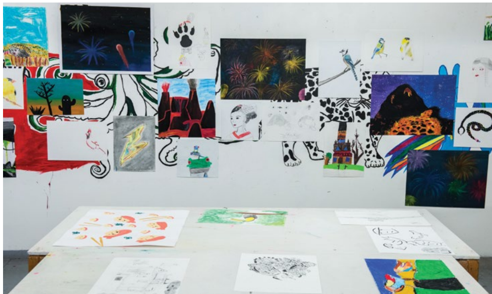
Cours enfants et adolescents, Journées Portes Ouvertes de l'isdat, mars 2016.