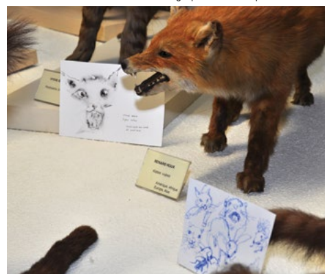
Cours adultes, exposition au Muséum de Montauban.