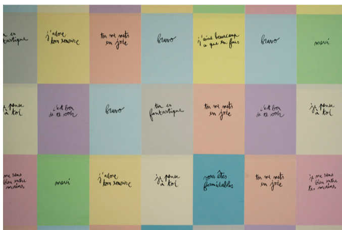
10 mots doux à partager, Camille Bondon, tapisserie, CHGR, Rennes, 2017.

Workshop ouvert aux étudiants en années 4 et 5 toutes options.