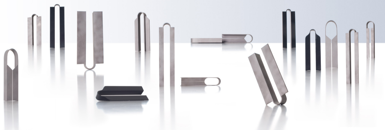
Sculptures chapitre I, projet de diplôme, Romain Jung © Romain Jung et Veronique Huyghe